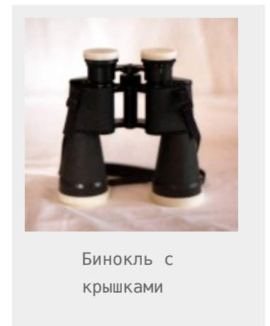
Бинокль с крышками

Корпус бинокля металлический, достаточно прочный, вес бинокля около килограмма. Габариты бинокля 195x195x60 мм. Поверхность корпуса шероховатая, стороны объективов и окуляров обрешиненные. Фокусировка изображения осуществляется вращением центрального маховика. Такой способ достаточно удобен, так как позволяет, не отрывая глаз от окуляра, производить перенастройку резкости изображения одним указательным пальцем. Диапазон фокусировки от «бесконечности» до 15-16 метров. На фокусировочном маховике нанесена шкала диоптрийной поправки от +10 до -5. Левый окуляр неподвижен, а правый окуляр вращается в пределах от +2 до -2. Это позволяет корректировать изображение в зависимости от зрения наблюдателя. Диапазон для настройки базы заключён в пределах 56 мм – 74 мм, вращение достаточно жёсткое и фиксируется без проблем в любом выбранном положении.