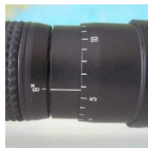
Фокусировщик и панкратическ ая система