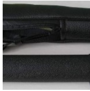
Труба и чехол