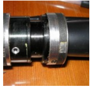
Оборачивающа я система