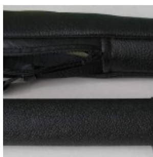
Труба и чехол