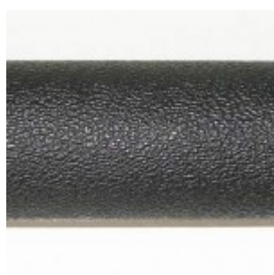
Труба в сложенном виде