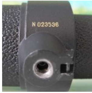
Резьба под фотоштатив