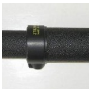
Труба в разложенном виде

Для начинающего астронома-любителя, ЗТ 8-24х40 – довольно неплохой инструмент. Конечно, апертура маловата, а наличие дополнительных оптических компонентов вносит искажения и светопотери. Но мобильность, малый вес и относительно низкая цена сглаживают эти недостатки, в целом инструмент заслуживает оценки “удовлетворительно”. В последствии я приобрел телескоп Celestron FS 70EQ, однако бывают моменты, когда даже маленькая “дудка” типа ЗТ 8-24х40 “играет”! В частности, именно с ее помощью я наблюдал частное лунное затмение 8 сентября 2006 года и полное лунное затмение 3 марта 2007 г.