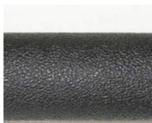
Труба в сложенном виде