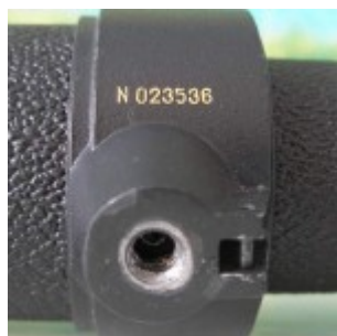
Резьба под фотоштатив