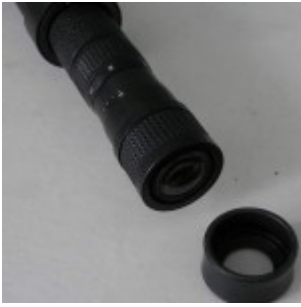
Окуляр и наглазник