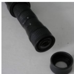
Окуляр и наглазник