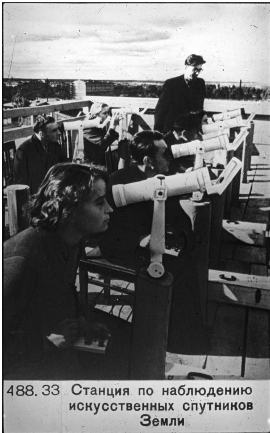
488. 33 Станция по наблюдению искусственных спутников Земли