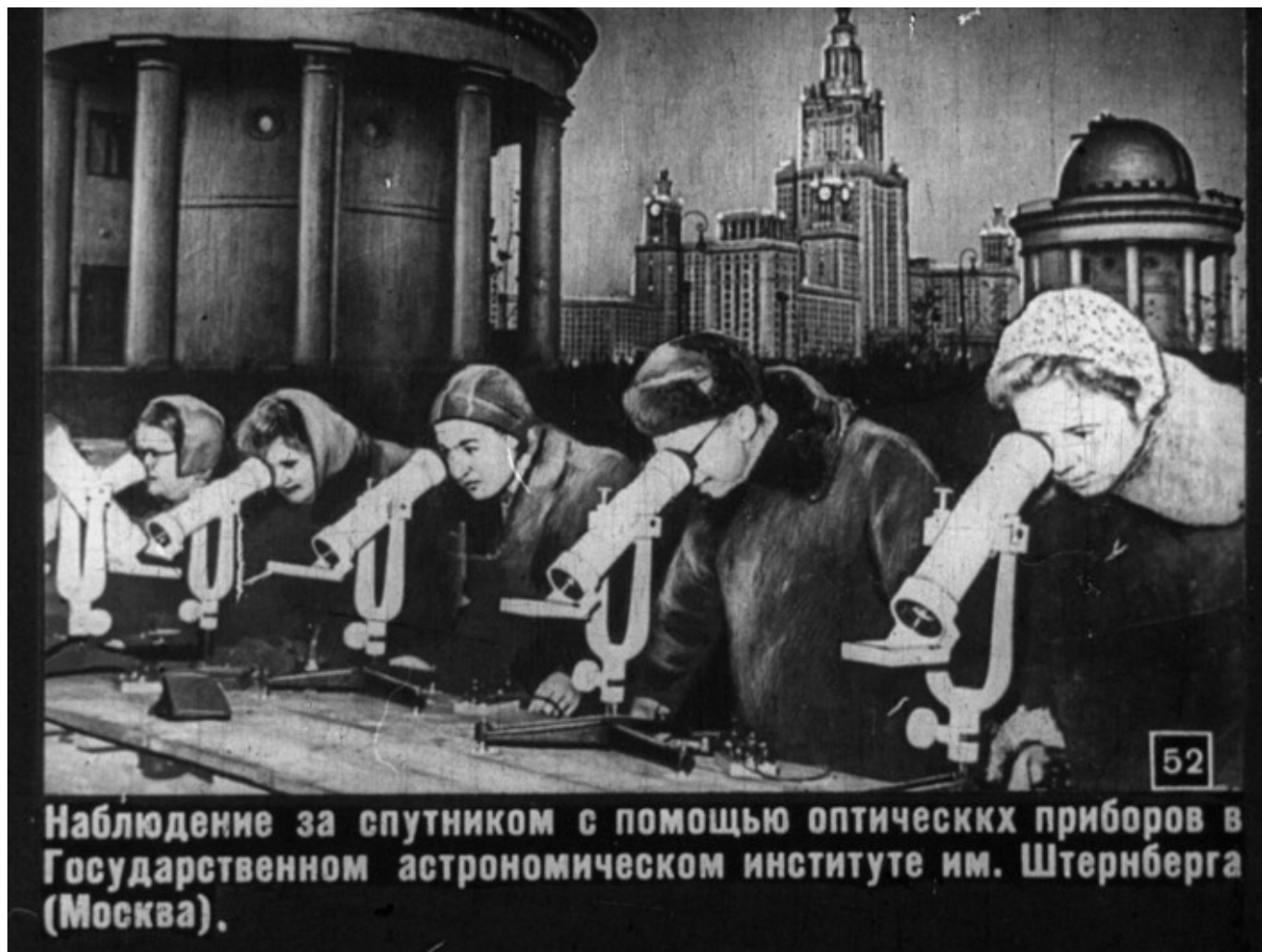
Наблюдение за спутником с помощью оптических приборов в Государственном астрономическом институте им. Штернберга (Москва).