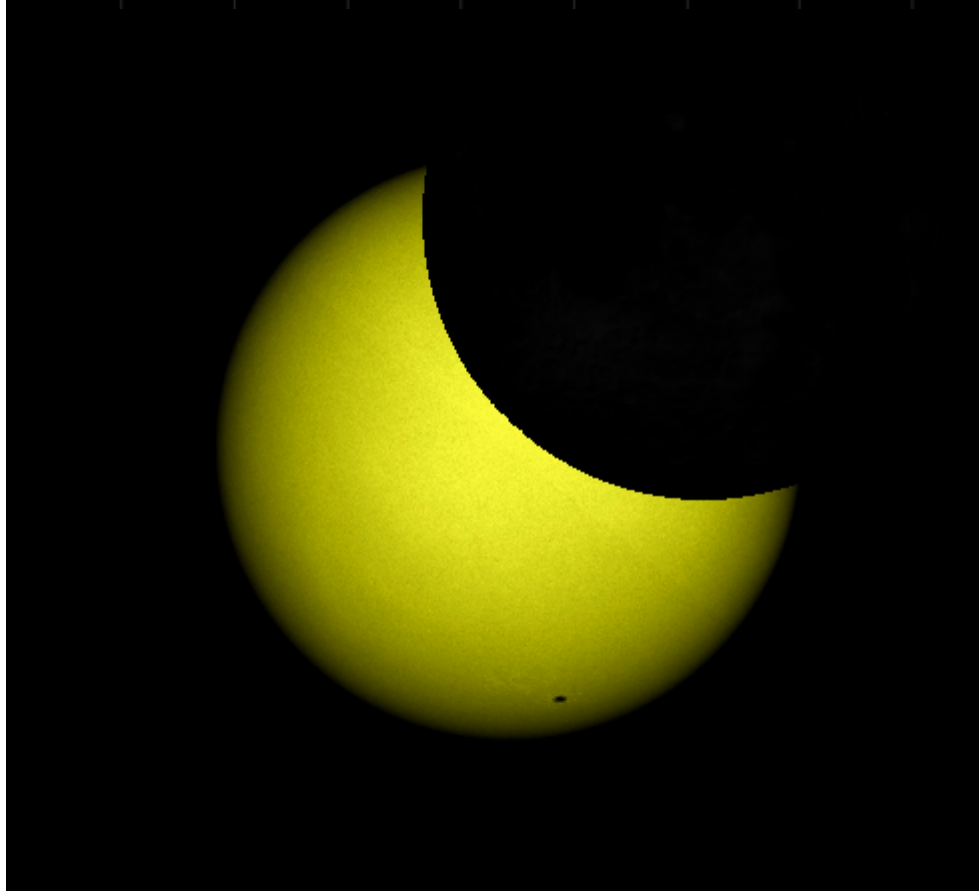
Макс. фаза в Новокузнецке