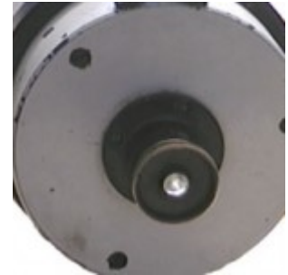
Окулярный узел и винты юстировки