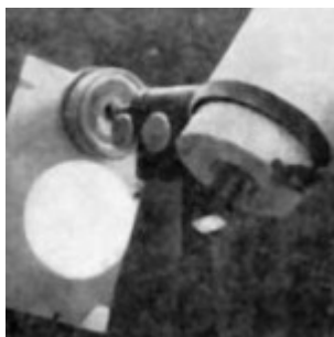
Экран для наблюдений Солнца