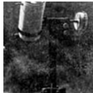
Монтировка снабжена противовесом и установлена на фотоштатив