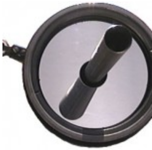
Трубка-отсекатель и задний диоптр с зеркальцем