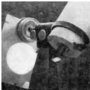
Экран для наблюдений Солнца