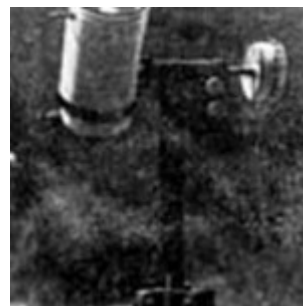
Монтировка снабжена противовесом и установлена на фотоштатив