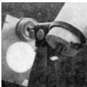
Экран для наблюдений Солнца