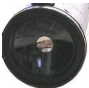
Вторичное зеркало нанесено непосредственно на мениск