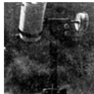
Монтировка снабжена противовесом и установлена на фотоштатив