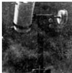
Монтировка снабжена противовесом и установлена на фотоштатив