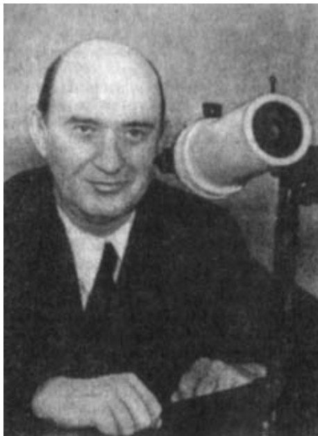
Д. Д. Максутов и его школьный телескоп

Характеристики телескопа: диаметр свободного отверстия – 70 мм, фокусное расстояние – 700 мм, увеличение с окуляром Кельнера – 50х, выходной зрачок – 1,4 мм., поле зрения – 48', угол разрешения – 3". Длина телескопа вместе с окуляром – 200 мм.