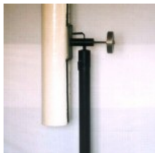
150-мм рефлектор Ньютона на азимутале

Первый телескоп. Это 150-мм телескоп-рефлектор Ньютона. Главное зеркало системы было изготовлено мной собственными силами. Я производил грубую обдирку зеркала, основной процесс шлифовки, а также полировки. Фигуризацию зеркала, доведение его поверхности производил специалист-оптик. Зеркало имеет рабочую поверхность в 148 мм, фокусное расстояние 1235 мм. Зеркало сферическое. При проверке поверхности зеркала использовался теневой метод Фуко. Зеркало имеет очень точную поверхность без каких-либо отклонений и дефектов. Диагональное зеркало имеет размеры 40 мм x 57 мм, оно имеет форму прямоугольника с усечёнными углами. Весь процесс изготовления телескопа составил примерно (включая оптику, трубу и штатив) 8-9 месяцев. В начале июня 1992 года я впервые направил эту трубу на небо. До этого я использовал в качестве наблюдательного инструмента 40 мм «Ньютон» на простом штативе-подставке. Этот самодельный телескопчик был мною куплен, когда я только увлёкся астрономией. Спустя год его уже заменил 150-мм «Ньютон», о котором я рассказываю.