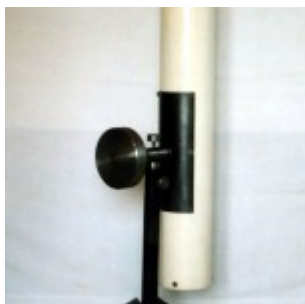
125-мм рефлектор Ньютона на азимутале

Второй телескоп. Диаметр рабочей поверхности главного зеркала 123 мм, фокусное расстояние 968 мм, система также «Ньютон». Телескоп был изготовлен спустя пару лет после первого. Труба телескопа бумажно-клеевая. Внутренний диаметр