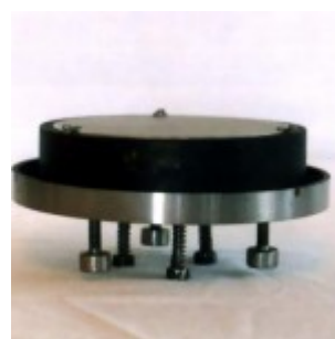
Оправа 150-мм зеркала в сборе

Оправа главного зеркала была сделана из стали. Это две чашки. Первая чашка крепилась в трубе, а во второй чашке находилось главное зеркало, которое удерживается в ней с помощью трёх лапок. Эта вторая чашка с зеркалом крепилась к первой. С внешней стороны оправы имеются три стопорных винта М6 с пружинами и три юстировочных М8. Так как оправка была изготовлена полностью из стали, то конструкция получилась очень тяжёлой. Впоследствии я заменил вторую чашку (в которой находится зеркало). Теперь эта чашка деревянная. Это дало заметный выигрыш в весе. Все детали (металлические и