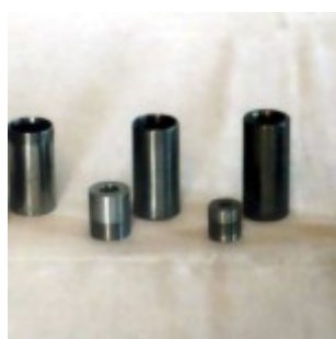
Окуляры и их втулки

Фокусирующее устройство представляет собой трубку, в которую вкручивается окуляр. Эта трубка с окуляром вставляется в цилиндр и работает на трении. Трение очень плотное, практически без люфтов. Сбоку имеется стопорный винт М6, который фиксирует трубку с окуляром в цилиндре в нужном положении. Цилиндр крепится к металлической пластине с помощью четырёх винтов М4, которая в свою очередь крепится к трубе телескопа. Для каждого окуляра изготовлена отдельная трубка, окуляры вместе с трубками просто переставляются для смены увеличения. Посадочный диаметр втулок составляет 26 мм.