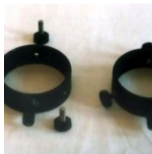
Крепежные кольца в разборе

На телескоп устанавливается искатель. Это маленький телескоп-рефлектор 40 мм/240 мм. Увеличение 12x. Поле зрения – 3 градуса. Устройство крепления состоит из двух металлических колец с тремя юстировочными винтами на каждом. К кольцам приварены ножки. Они соединяются с трубой с помощью болтов.