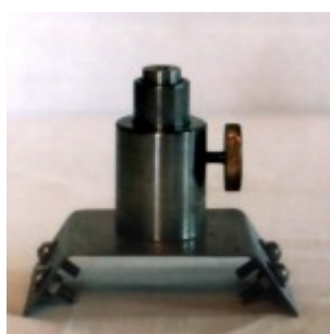
Окулярный узел с окуляром