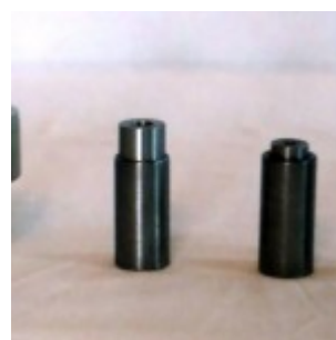
Окуляры в сборе

Все окуляры самодельные. Оптику для них я брал из старого