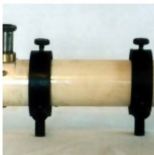
Искатель в крепежных кольцах

диапроектора, объективов детских микроскопов, объектива старого фотоувеличителя, объектива «Индустар» от старого фотоаппарата «ФЭД-3». Из всего этого удалось создать несколько вполне годных окуляров. Для каждого окуляра были изготовлены индивидуальные оправы, но все они адаптированы под фокусирующее устройство телескопа. Со 150-мм телескопом получились следующие увеличения: 48x (поле 1^{\circ}03' ), 70x (поле 38,5' ), 100x (поле 20' ). С окуляром 100x используется специальная вставка (2,1x одиночная линза Барлоу). Этот окуляр состоит из двух одинаковых дуплетов, так что можно считать его симметричным. Он показал наиболее хорошие результаты с линзой Барлоу. Этот комплект окуляров является рабочим. Он применяется мной с обоими телескопами.