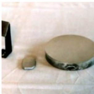
125-мм зеркало и диагональ