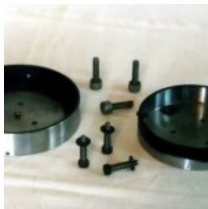
Оправа 125-мм зеркала в разборе