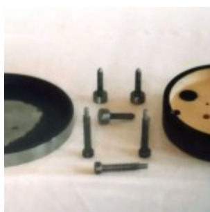
Оправа 150-мм зеркала в разборе