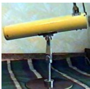
60-мм телескоп-рефлектор на подставке

Малый телескоп. Ещё одно готовое зеркало 60 мм/560 мм я взял у другого своего знакомого. Труба из плотного картона, оправа главного зеркала из дерева, стойка для вторичного, фокусер как у предыдущих моих телескопов, штатив от маленького 40-мм телескопа (тот, который сейчас используется в качестве искателя). Высоту штатива пришлось увеличить, опорную пластину (диаметр) тоже. Дополнительно изготовил несколько окуляров, приставку с линзой Барлоу (разобрал пару объективов от фотоаппарата «Смена»). Получился вполне приличный маленький телескоп. Изображение давал очень качественные. Этот телескоп, несколько лет назад, я отдал в подарок одному своему знакомому.