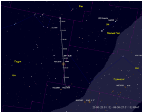
Путь астероида 2004 BL86

680-метровый астероид 2004 BL86 ночью 26-27 января пройдет на расстоянии 1,2 млн. км от Земли. При максимальном сближении астероид будет иметь блеск около 9 m и видимое движение более 5"/сек . Видимость явления из Сибири хорошая, хотя максимальное сближение произойдет уже после захода астероида за горизонт. Кульминация астероида в Кузбассе произойдет около часа ночи 27 января на высоте 29° в созвездии Гидры. В 6 часов утра астероид будет на границе Гидры и Рака, на высоте 15,5° с расчетным блеском 9,4 m .