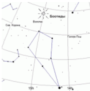
Радиант Июньских Боотид

Июньские Боотиды. Начало активности – 26 июня, конец – 2 июля. Максимум активности приходится на 27 июня (зенитное часовое число – 20, переменное). Сред. скорость – 18 км/с. Координаты радианта: \alpha = 15^h ; \delta = +48^\circ (ближайшая яркая звезда – \beta Волопаса). До недавнего времени поток считался угасающим, но после неожиданного всплеска в 1998 г., когда зенитное часовое число 50 – 100 наблюдалось в течение половины суток, этот поток был повторно включен в список визуальных метеорных потоков. 23 июня 2004 г. наблюдался похожий всплеск.